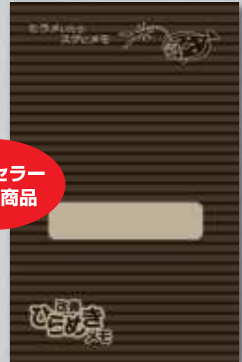
改善ひらめきメモ (茶)