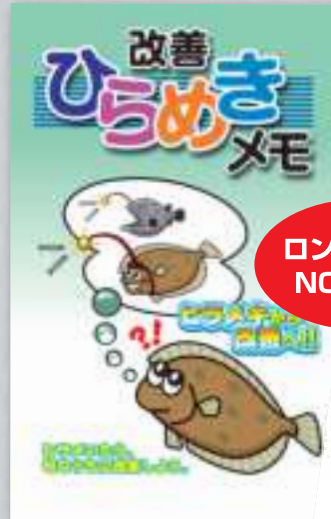
改善ひらめきメモ